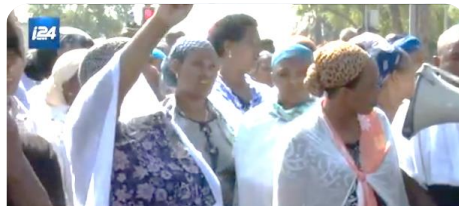
TENSIONS BETWEEN ISRAELI POLICE, ETHIOPIANS ON THE RISE

۶۰ افسر سیاه پوست ارتش رژیم صهیونیستی با ارسال نامه ای به رئیس ستاد ارتش این رژیم تقاضا کردند تا برای پایان دادن به روند سعودی نژادپرستی و تبعیض نژادی که اکنون در ساختار ارتش اسرائیل روبه رشد است، تدابیری را ببندیشند.