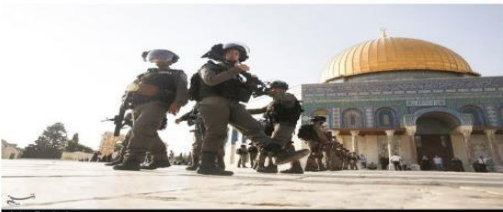
دبیرخانه دائمی کنفرانس بین المللی حمایت از انتفاضه فلسطین مجلس شورای اسلامی تصویب قانون آزادپرستانه تشکیل دولت یهودی از سوی کنگست (پارلمان) جمعی رژیم اشغالگر قدس در مورخ ۲۸ تیرماه ۱۳۹۷ را به شدت محکوم کرد.